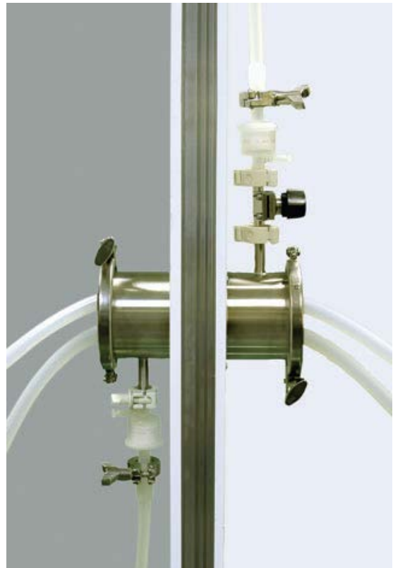
Här installerad med ventilerad av filtrerad luft

Systemet kan spara tusentals kronor jämfört med andra genomförings-tekniker. Vid användning av "Single-Use" sparas också kostnader för sterilisering och validering jämfört med fasta rörsystem.