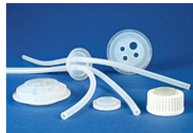
Opigmenterade proppar och genomföringar för flaskor med skruvlock