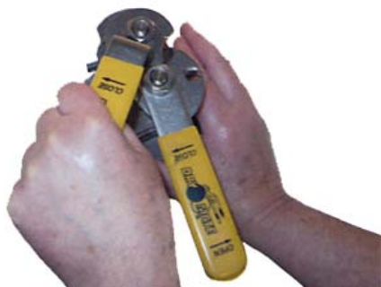
3. Öppna ventilen