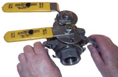
2. Fäll ner låsbyglarna