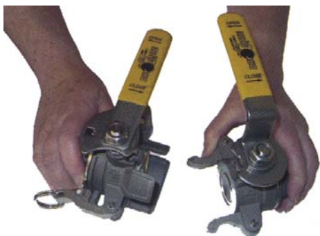
1. För ihop kopplingshalvorna