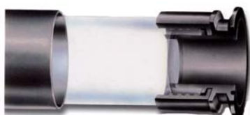
FEP fluoropolymer utan stödbur