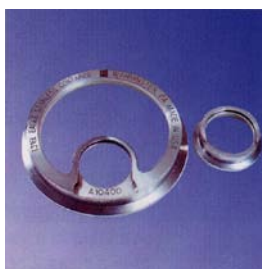
Synglas med stor öppning för TC klämfläns