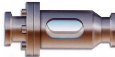
Pyrex® glas med öppningsbar fläns