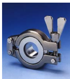
Synglas för TC klämfläns