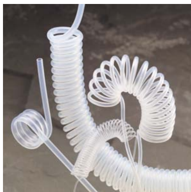
Fluorpolymer – oarmerad "teflon" Datablad DB0762