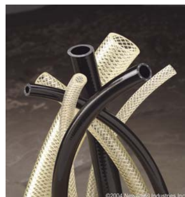
Urebrade – armerad polyuretanslang Datablad DB0701