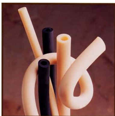
Suprene – termogummislang Datablad DB0692