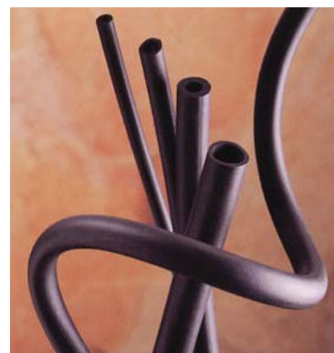
Vitube – fluorgummislang (viton) Datablad DB0685