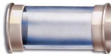
Synglas i Polysulfon med flänsar