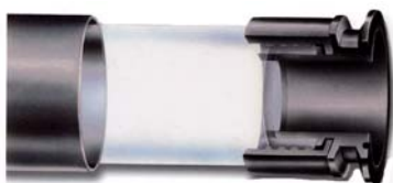
FEP fluoropolymer utan stödbur