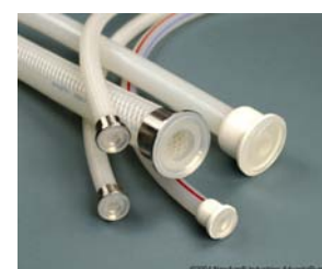
Gjutna TC anslutningar

Hose-Track™, ett unikt system som lagrar information om slangens lottnummer, användning, sterilisering etc. för full kontroll och spårbarhet