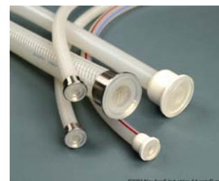
Gjutna TC anslutningar

Hose-Track™, ett unikt system som lagrar information om slangens lot.nummer, användning, sterilisering etc. för full kontroll och spårbarhet