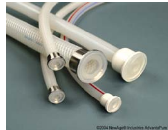
Gjutna TC anslutningar

Hose-Track™, ett unikt system som lagrar information om slangens lot.nummer, användning, sterilisering etc. för full kontroll och spårbarhet