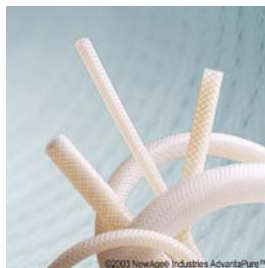
Vävarmerad slang, platinahärdad, USP klass VI