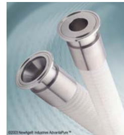
Wirearmerad slang, platinahärdad, USP klass VI