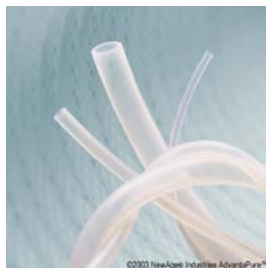
Oarmerad klar slang, platinahärdad, USP klass VI