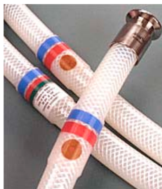
Hose-Track™, ett unikt system som lagrar information om slangens lot-nummer, användning, sterilisering etc. för full kontroll och spårbarhet