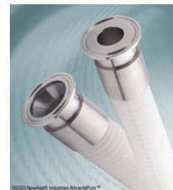
Wirearmerad slang, platinahärdad, USP klass VI