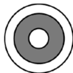
Rund, ihålig (endast silikon)