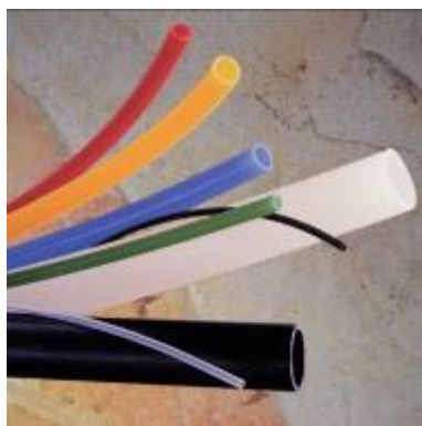
Nylotube – nylon slang