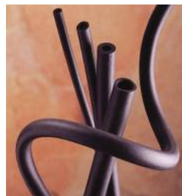
Vitube – fluorgummislang (Viton)