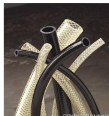
Urebrade – armerad polyuretanslang