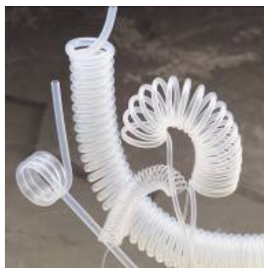
Fluorpolymer – oarmerad "teflon"