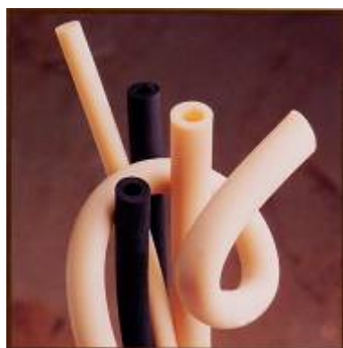
Suprene – termogummislang