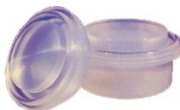
Opigmenterade proppar och genomföringar för flaskor med skruvlock