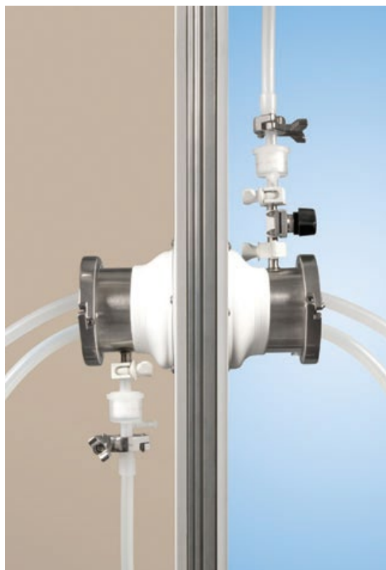
Här installerad med ventilering av filtrerad luft

Systemet kan spara tusentals kronor jämfört med andra genomförings-tekniker. Vid användning av "Single-Use" sparas också kostnader för sterilisering och validering jämfört med fasta rörsystem.