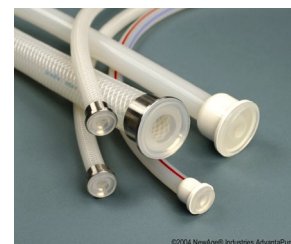
Gjutna TC anslutningar

Hose-Track™, ett unikt system som lagrar information om slangens lottnummer, användning, sterilisering etc. för full kontroll och spårbarhet