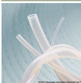
Oarmerad klar slang