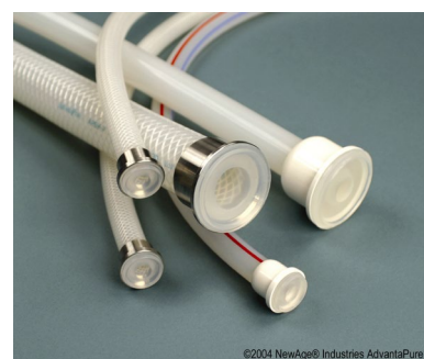
Gjutna TC anslutningar

Hose-Track™, ett unikt system som lagrar information om slangens lottnummer, användning, sterilisering etc. för full kontroll och spårbarhet