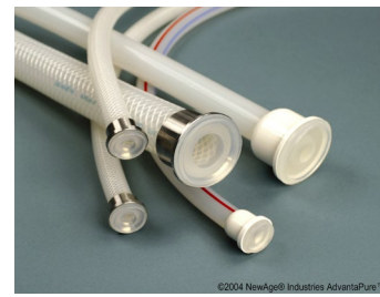
Gjutna TC anslutningar

Hose-Track™, ett unikt system som lagrar information om slangens lot.nummer, användning, sterilisering etc. för full kontroll och spårbarhet