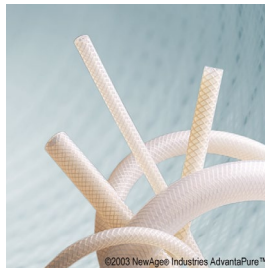
Vävarmerad slang, platinahärdad, USP klass VI