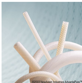
Vävarmerad slang, platinahärdad, USP klass VI