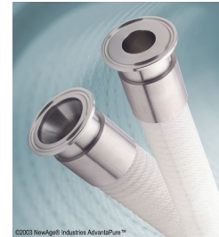
Wirearmerad slang, platinahärdad, USP klass VI