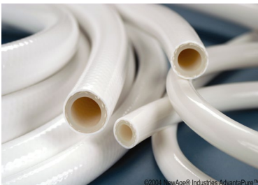
Dubbelarmerad slang, platinahärdad, USP klass VI