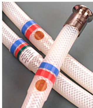
Hose-Track™, ett unikt system som lagrar information om slangens lot.nummer, användning, sterilisering etc. för full kontroll och spårbarhet