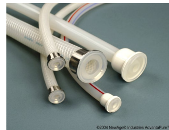
Gjutna TC anslutningar