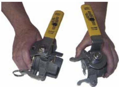
1. För ihop kopplingshalvorna