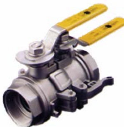
4. Färdig att använda