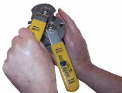
3. Öppna ventilen