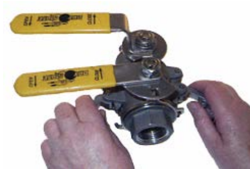
2. Fäll ner låsbyglarna