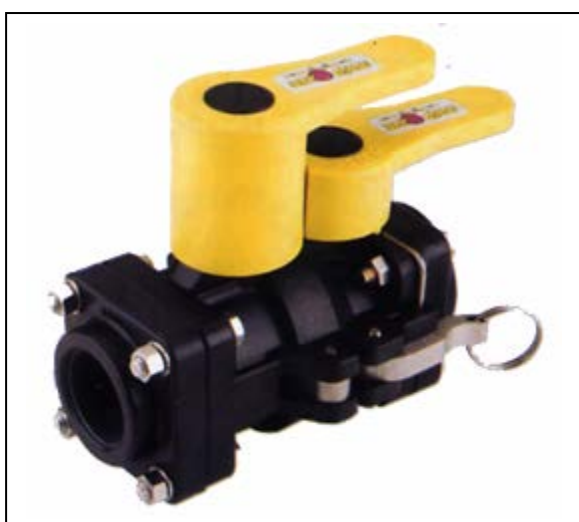
Saniflex DryMate tillverkad i polypropen