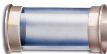
Synglas i Polysulfon med flänsar