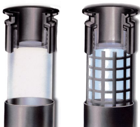
FEP fluoropolymer utan/med stödbur

Några exempel på andra synglas i vårt sortiment: