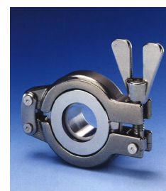
Synglas för TC klämfläns